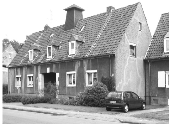
Ehemaliges Durchgangsgebäude, Taunusstr.