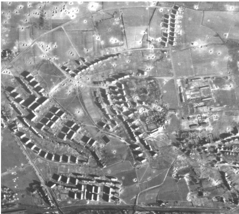
Bis 1945 erreichter Ausbauzustand