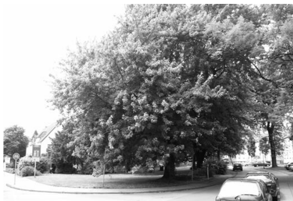
Beispiele schützenswerter Grünflächen