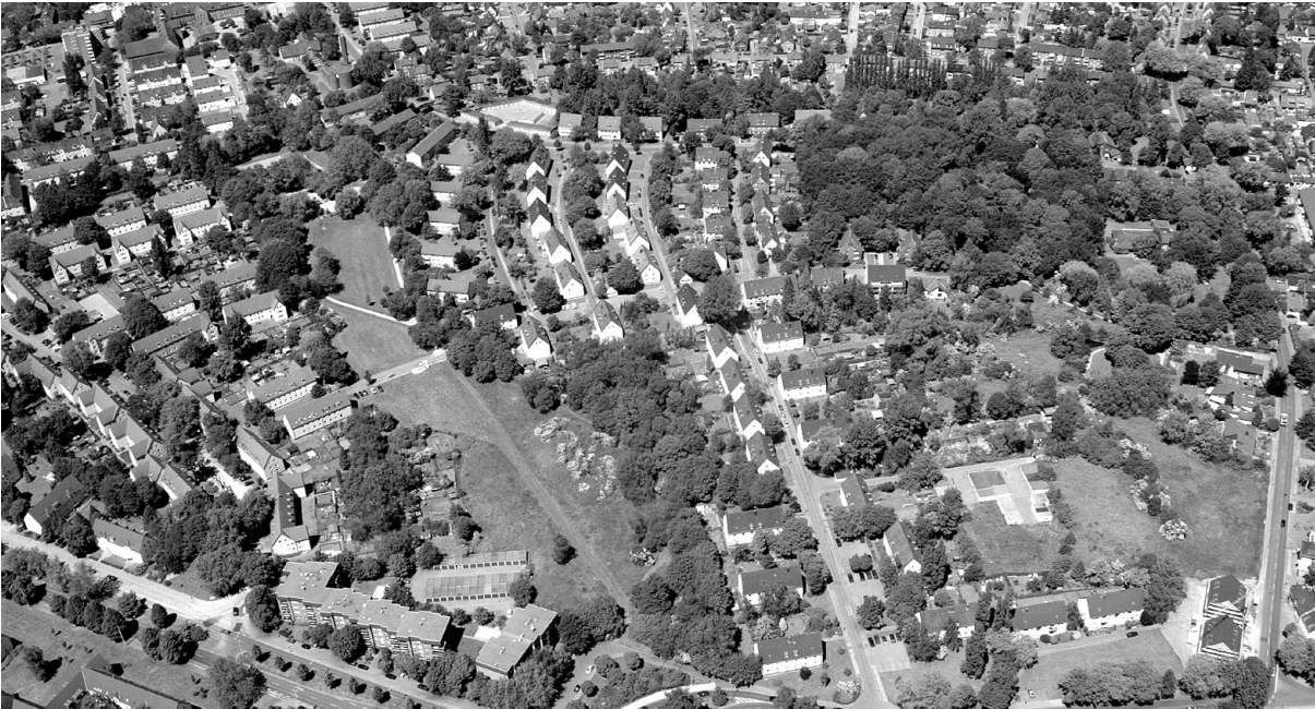
Rosenhügel, Luftbild 2003

versagen sind, wenn die bauliche Anlage allein oder im Ensemble das Ortsbild, die Stadtgestalt oder das Landschaftsbild prägt oder - wenn dies nicht der Fall ist - von städtebaulicher Bedeutung ist. Auch Neubauten müssen diesen Anforderungen entsprechen und können ggf. untersagt werden.