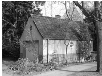
Gestalterische Details in Rosenhügel

Die ‚landschaftsspezifische‘ Ausführung der Gebäude, wie sie der Heimatschutz eigentlich lange Zeit gefordert hat, bleibt auf der anderen Seite bereits auf die Verwendung von Ruhrsandstein zur Verblendung des Gebäudesockels und zur Einfassung der Eingangsbereiche reduziert. (...) Neben den architektonischen Details lassen sich darüber hinaus an der Umgebungsgestaltung typische Elemente des Heimatschutzes ablesen: Die Vorgärten wurde als schlichte, schmale Grünstreifen ausgeführt, Einfriedungen einzelner Grundstücke durch Mauern oder Zäune gibt es so gut wie gar nicht. Der Zusammenschluss einzelner Häusergruppen durch gemeinsame Gartenmauern (die ebenfalls in Ruhrsandstein ausgeführt sind) ist ebenfalls als Gegenposition zur durch die von der funktionalistischen Moderne geforderten ‚offenen Bauweise‘ zu verstehen. Die häufig durch solche Gartenmauern eingebundenen Nebengebäude (Ställe und vor allem Garagen) sind den Hauptgebäuden gestalterisch angeglichen, auch sie verfügen über Satteldächer und Sockel aus Ruhrsandstein.